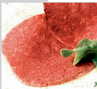
Corned-Turkey Spitzenqualität, mittelgrob gekörnt, ca. 25 Scheiben