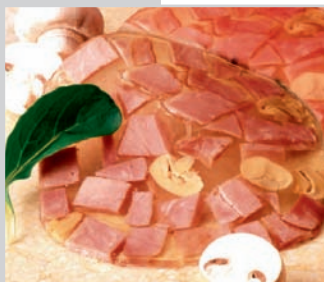
Schinken „Champignons“ in Aspik ca. 25 Scheiben