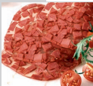
Kalbsfleisch in Aspik ca. 25 Scheiben