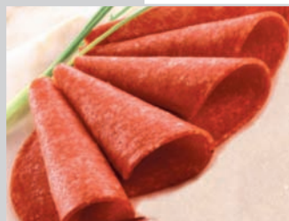
Westf. Salami IA ca. 35 Scheiben