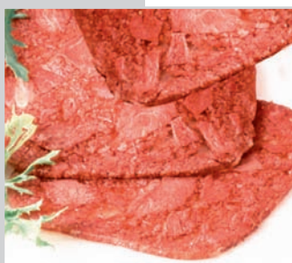
Corned-Beef Spitzenqualität, mittelgrob gekörnt, ca. 25 Scheiben

Paul Daut GmbH & Co. KG Schmeerplatzweg 11 33378 Rheda-Wiedenbrück Phone (+49) 52 42/59 04 - 0 Fax (+49) 52 42/59 04 35 e-mail: info@sprehe.de Internet: www.sprehe.de