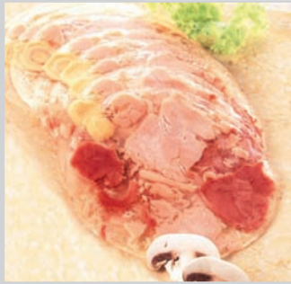
Putenfleisch in Aspic geschnitten, ca. 25 Scheiben