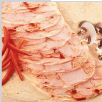
Hähnchenfleisch in Aspic geschnitten, ca. 25 Scheiben