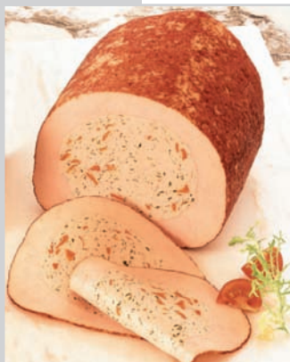
Putenbrust gefüllt mit Broccoli gegrillte Putenbrust, gefüllt mit pikantem Geflügelfleischbrät, Broccoli und Möhren