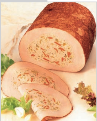
Hähnchenbrust „Gärtnerin“ Gemüsefüllung, umgeben von einem gegrillten Hähnchenbrust- fleischmantel