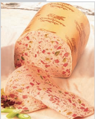
Truthahn- Spargelpastete aus frischem Geflügelfleisch von besonderer Qualität, mit grünem Stangenspargel, halbe Stücke